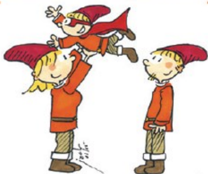
Les mots qui font grandir les enfants, les parents et la relation

Envie d'une relation confiante et apaisée avec vos enfants?